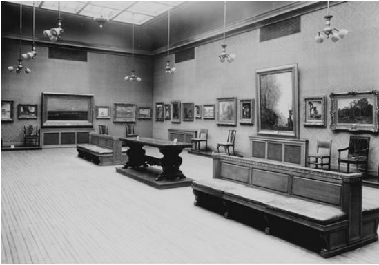
La Art Gallery de la Art Association of Montreal, au 1379, rue Sherbrooke Ouest. Salle d'exposition, premier étage, vers 1913.