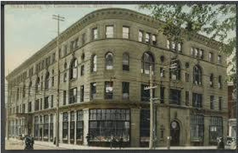
Maison Birks, rue Sainte-Catherine. Architecte : Edward Maxwell.

La Maison Birks est une bijouterie fondée en 1879 par Henry Birks. D'abord située sur la rue St-Jacques dans le Vieux-Montréal, elle est déménagée au Square Phillips en 1894. L'édifice fut construit par l'architecte canadien Edward Maxwell. On doit aussi à Maxwell les bâtiments de la Unitarian Church of the Messiah et le pavillon Michal et Renata Hornstein du Musée des beaux-arts de Montréal. Des modifications ont été apportées à l'édifice à trois reprises (1902-1906, 1931, 2017-2018).